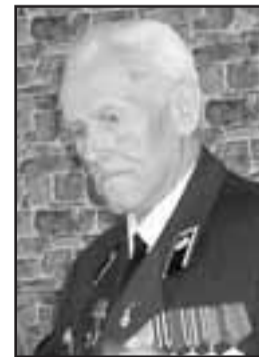
Фото: На встрече участников и ветеранов Великой Отечественной войны по случаю 65-летия Великой Победы 4 мая в кафе «Вечер».