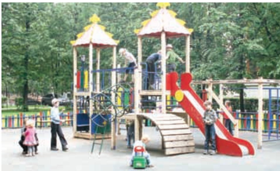
Общая сумма работ по благоустройству составила – 6 168,2 тысячи рублей, что на 1% больше по сравнению с прошлым годом.

Выполнен ремонт тротуаров – 24 342 кв. м, ремонт асфальтового покрытия – 384,2 кв. м, ремонт ограждения спортивных площадок – 141