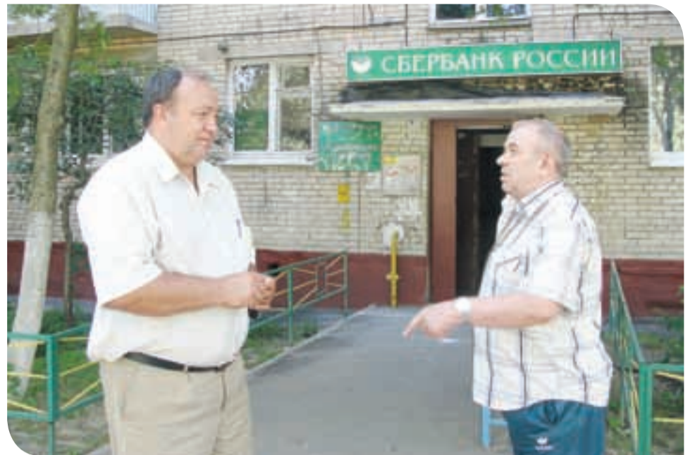
«Сегодня здесь тихо. А завтра клиенты Сбербанка займут все лавочки для отдыха».

Вот и едут, и идут подрезковцы со всей территории в отделение Сбербанка, на ту самую северную окра-